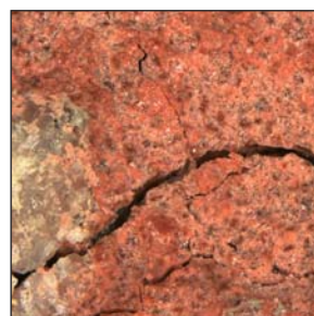
Вид усадочной трещины в окрашенном красным цветом бетоне (32-х кратное увеличение)

Объемная гидроизоляция бетона и эффект самолечения статических трещин до 0,4 мм. Активные компоненты C16 и C17 реагируют со свободной известью и влагой в бетоне, образуя миллионы кристаллических волокон (нанокристаллов), проникающих в поры капилляров и закупоривающих усадочные трещины.